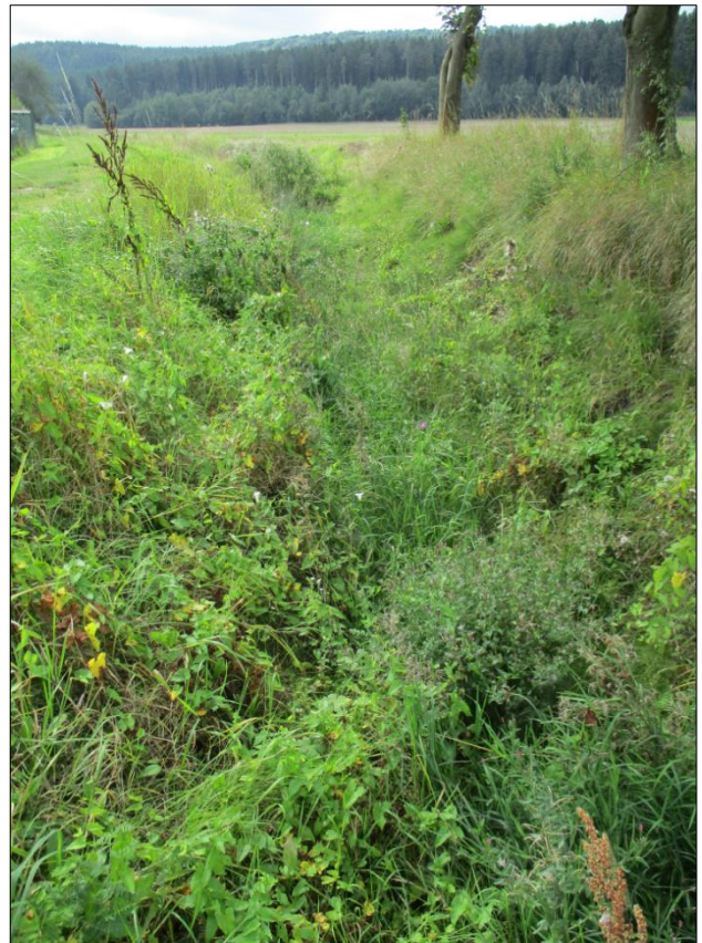
Abbildung 2: Zufluss zum Krumbach bei Hohenfelden – ein Gewässer zweiter Ordnung mit zeitweiser Wasserführung (rechts) und einem Einzugsgebiet von 87,5 ha (links)

Einige Kriterien können anhand vorhandener Unterlagen bzw. Fachinformationssysteme geprüft werden, wie Größe des Einzugsgebietes (siehe Abbildung 2), Erosionsgefährdung im Einzugsgebiet oder bestehende Erlaubnisse zur Abwassereinleitung. Andere, wie z.B. Angaben zur Wasserführung, müssen gegebenenfalls bei einer Ortsbesichtigung geklärt werden. Auch wenn bei zeitweilig wasserführenden Gräben oft keine konkreten Angaben zu Dauer und Häufigkeit der Wasserführung gemacht werden können, kann die vorhandene Grabenvegetation Hinweise dazu liefern: Grasbewuchs in der Sohle deutet auf eine seltene Wasserführung hin, während Binsen, Rohrkolben und andere Nässezeiger (siehe Abbildung 3) auf eine regelmäßige Wasserführung (in der Regel > 250 Tage im Jahr) hindeuten.