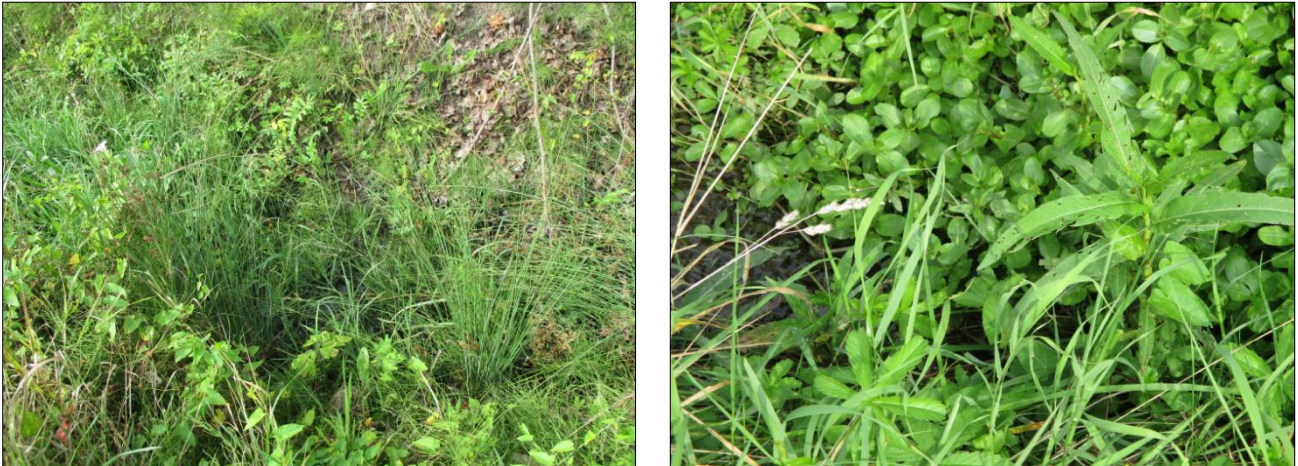
Abbildung 3: Binsen (links) sowie Wasserpfeffer und Sumpfergissmeinnicht (rechts) deuten als Nässezeiger auf eine regelmäßige Wasserführung hin.